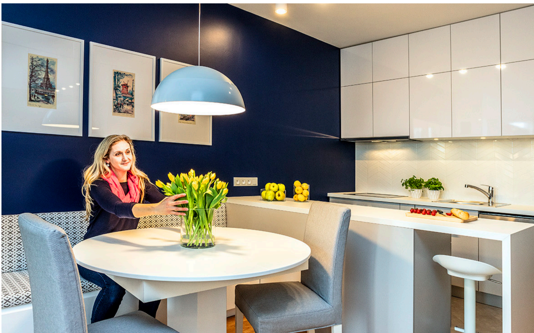
Kuchyň a jídelna bytu v Praze Stodůlkách po rekonstrukci

A to mě inspirovalo a začala jsem sdílet svoje zkušenosti nejen se svými klienty, ale s každým, kdo právě zařizování řeší a mohly by se mu moje zkušenosti hodit. Takže třeba i Vám, protože to je asi důvod, proč čtete tento e-book. 😊