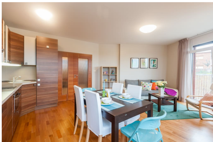
(E1) Z nové rozkládací pohovky je výhled do zeleně

Nová rozkládací pohovka se přemístila na druhou stranu pokoje a je z ní nyní hezký výhled jak na zeleň za velkými okny tak na televizi, kuchyň a jídelní stůl. Na obrázku (E1) a (F1) můžete vidět, jak se díky jednoduchému přesunu nábytku vytvořil v místnosti příjemný komunikační prostor pro všechny obyvatele bytu.