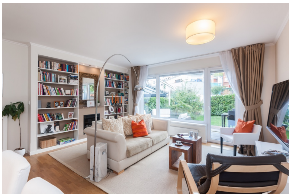
Třímístná pohovka a dvě křesla jsou pro čtyřčlennou rodinu dostatečné a prostor působí vzdušně. RD, Praha