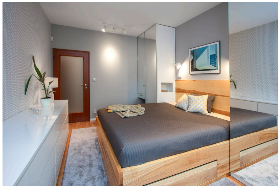
Výmalba ke stopu, ložnice, byt, Praha