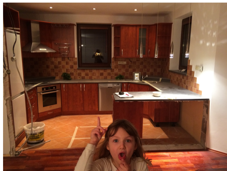
Kontrola demoličních prací u klientky ve Kbelích 😊