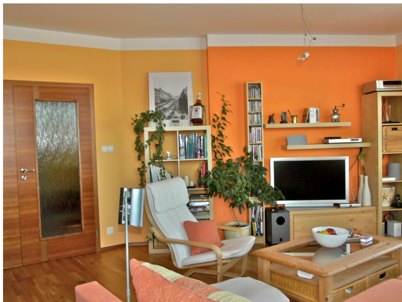
(G) Bílý pruh u stropu

Proto i pokud je strop křivý, pokuste se udělat linku mezi stropem a zdí co nejbliž stropu. Pokoj bude vypadat mnohem větší.