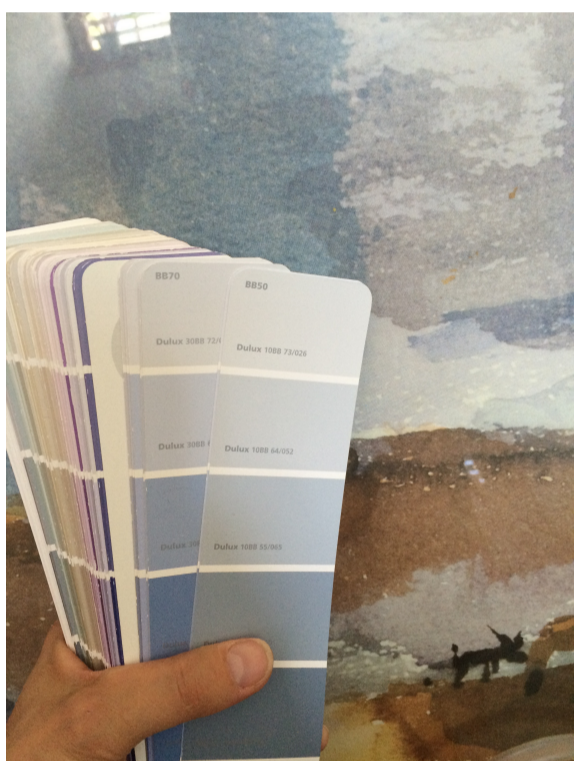
Výběr odstínu na základě obrazu

Pokud chcete zdi pouze natónovat, vybírejte z těch nejsvětlejších barev na konci vzorníku.