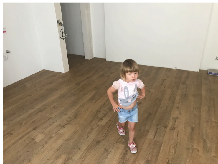
Kontrola pokládky podlahy v bytě na Břevnově 😊