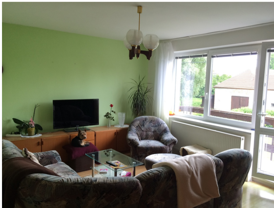
Velká rohová pohovka a křeslo daný prostor úplně zahltí

V malých prostorách navíc upřednostněte nábytek na nožičkách . Prostor bude působit opticky větší .