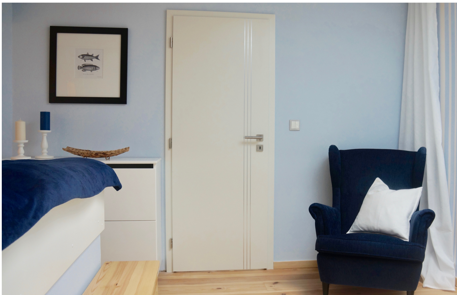
Ložnice pro hosty, byt Praha