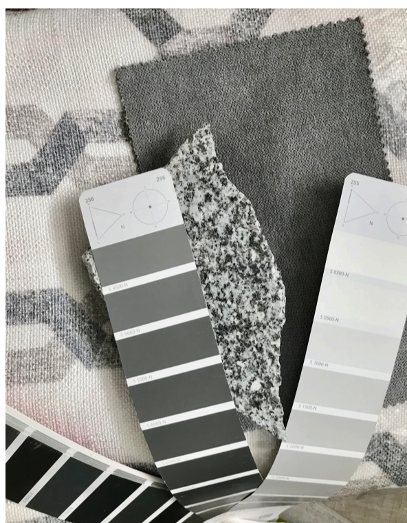
Barevná paleta pro kuchyň a OP

Pokud chcete hodně sytou barvu, spíše než na všechny zdi ji namalujte na zed', na kterou dopadá nejvíce světla, nejlépe tedy na zed' naproti oknu.