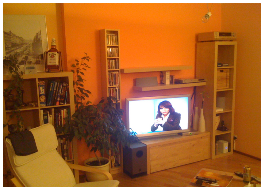
(F) V televizi se odráží světlo z protilehlých oken

Nová rozkládací pohovka se přemístila na druhou stranu pokoje a je z ní nyní hezký výhled jak na zeleň za velkými okny tak na televizi, kuchyň a jídelní stůl. Na obrázku (E1) a (F1) můžete vidět, jak se díky jednoduchému přesunu nábytku vytvořil v místnosti příjemný komunikační prostor pro všechny obyvatele bytu.