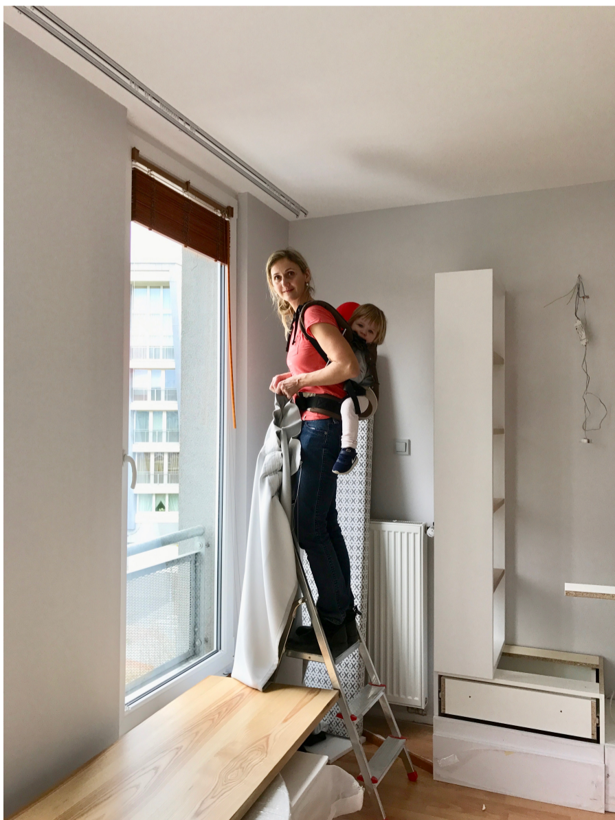
Téměř každého mého projektu se v určité fázi účastní moje děti 😊

Vtipné bylo, že když jsem čekala svoji druhou dceru v roce 2014, ta stejná klientka mě kontaktovala s tím, že se bude stěhovat a zadala mi zařízení celého nového domu. Projekt jsem odevzdala v březnu 2015 a ještě tu noc jsem porodila. V legraci jsem požádala klientku, ať už se nestěhuje, protože další dítě už neplánuji. 😊