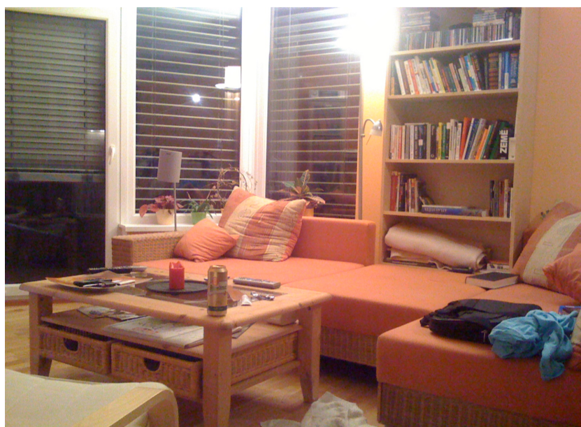
(E) Velká pohovka zabírá většinu zdi s okny

Je buď příliš velký v malém pokoji nebo příliš malý ve velkém pokoji. Nejčastějším příkladem je pohovka. Již je to nějaký ten pátek, co se většina českých domácností rozhodla, že musí mít velkou rohovou pohovku. A to i přesto, že se k ní vlastně téměř nedá probojovat, protože uličky mezi nábytkem jsou proklatě úzké. Navíc často trpí nedostatkem prostoru jídelní stůl. Není výjimkou, že je stůl přiražen ke zdi delší stranou a pouze když přijde návštěva, stůl se posune ode zdi. Na obrázku (E) je pohovka, která nejen, že je velká, ale je i nevhodně umístěná. Na obrázku (F) je televize, která je umístěna naproti pohovce a přes den se na ni nedá dívat, protože se v ní odráží světlo z velkých oken naproti.