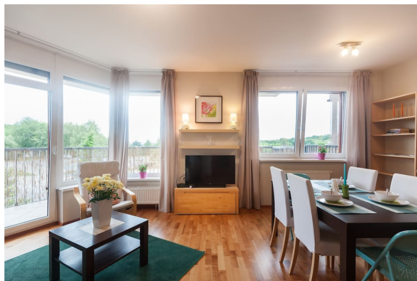
(F1) Televize se přemístila na praktičtější místo mezi okna