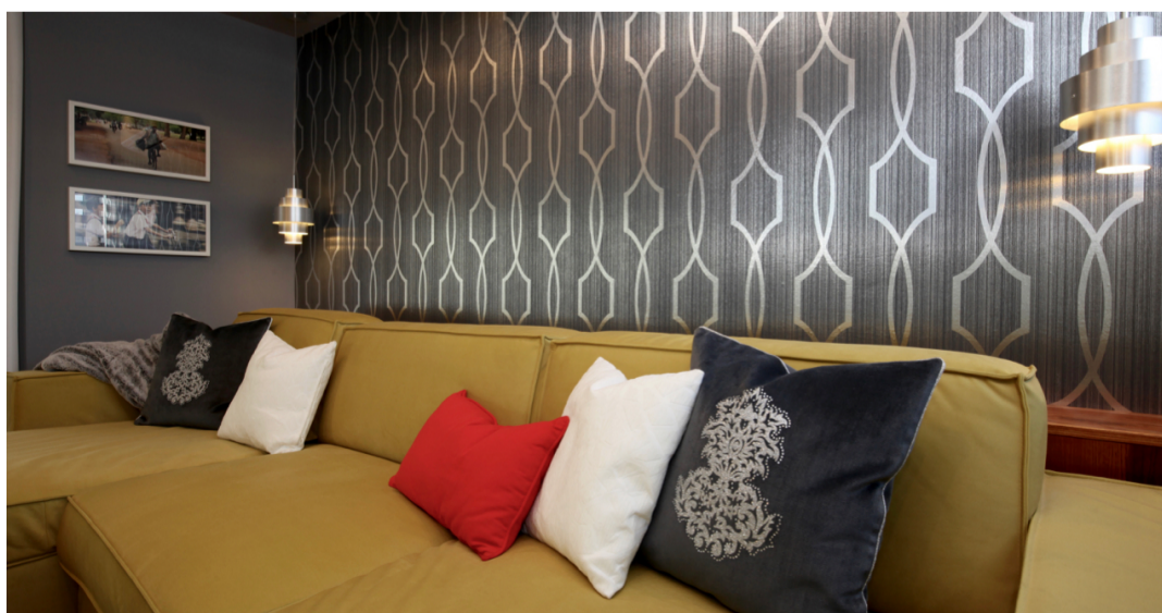
Tmavá tapeta vytváří zajímavé pozadí barevné pohovce, byt, Praha

Pokud chcete hodně sytou barvu, spíše než na všechny zdi ji namalujte na zed', na kterou dopadá nejvíce světla, nejlépe tedy na zed' naproti oknu.